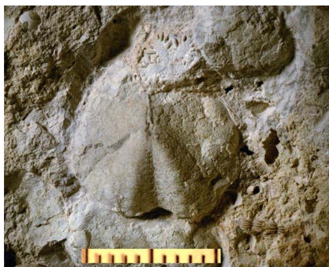
Overside og front af søpindsvin, foraminiferen Nodosaria samt aftryk af isocrinoid stilked.

Blokken annoteret: 1=Irregulære søpindsvin; 2=Nautilskal; 3=Aftryk af et stykke stilk af en isocrinoid sølilje; 4=Snegl, Ravniella; 5=Stor flade med aftryk af kiselsvamp, Ventriculites. Ikke synligt på foto er et par storforaminiferer, Nodosaria. Der er yderligere sneglearter i blokken.