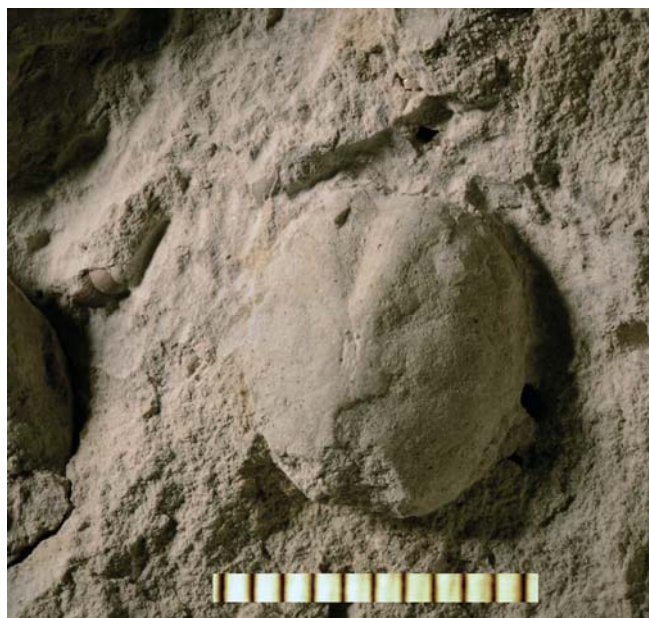
Et andet eksemplar af søpindsvinene samt skal af snegl.